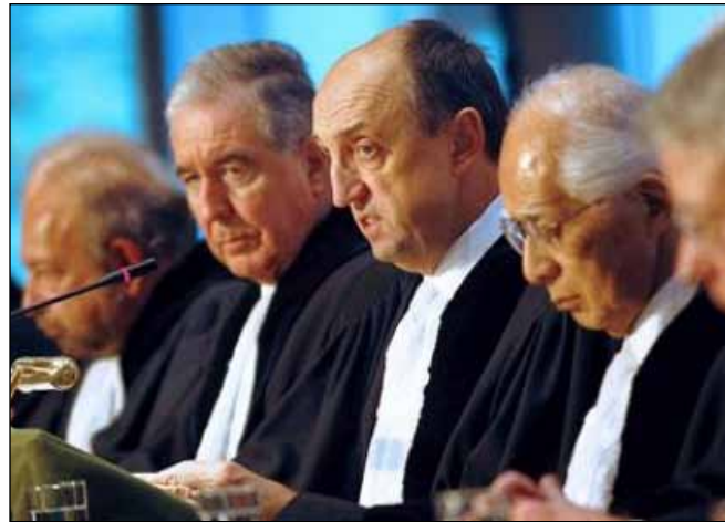
La Corte Internacional de Justicia redefinió la frontera marítima entre Nicaragua y Colombia.

Las omisiones, errores, excesos de Colombia