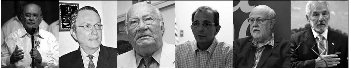
Los cancilleres Miguel D'Escoto, Ernesto Leal, Emilio Álvarez, Eduardo Montealegre, Norman Caldera y Samuel Santos.