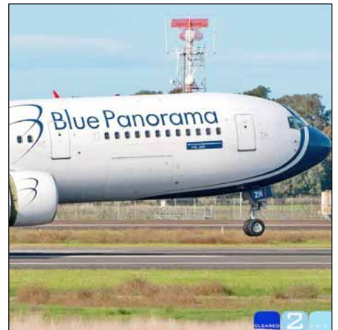
Los aviones de Blue Panorama quizás regresen hasta en julio del 2013.

El aterrizaje de la primera aeronave en el Aeropuerto Internacional de Managua el pasado 11 de julio –un Boeing 767-300 con 20 pasajeros (su capacidad total es de 272 personas) procedente de Roma, se celebró con bombo y platillos, como el inicio de una nueva etapa en la historia de la aviación comercial de Nicaragua y Centroamérica. Personeros de la empresa y del gobierno, entre ellos el general Jorge