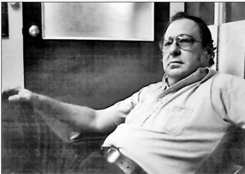
Pedro Joaquín Chamorro Cardenal.