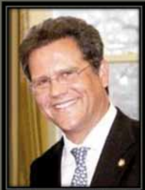
Dr. Arturo Cruz Sequeira Ex Embajador de Nicaragua en los EEUU y Profesor del INCAE.

Venezuela y Estados Unidos. 2 elecciones...guardando las distancias, 2 sistemas: ¿2 oportunidades?