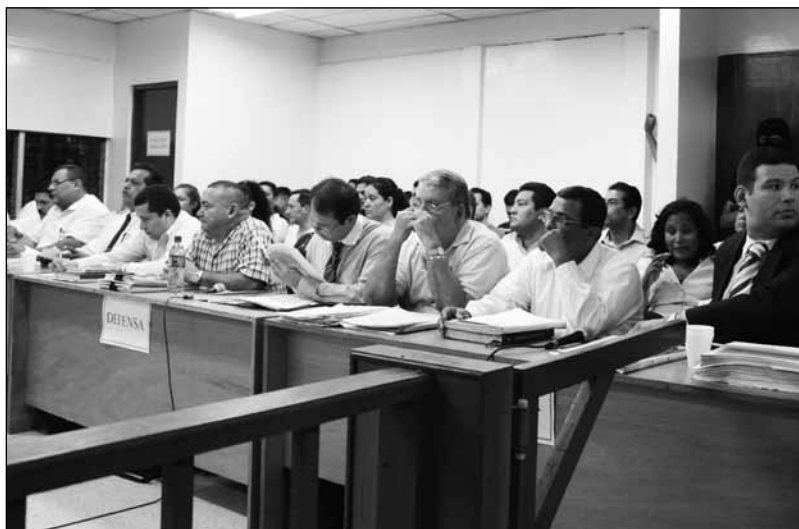
La defensa se queja porque los ‘testigos’ no responden sus preguntas.

La segunda sesión del juicio inició a las 3:30 pm y se suspendió a las 9:30 pm por una torrencial lluvia acompañada de tormenta eléctrica.