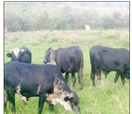
El ganado pasta donde debería estar cubierto de bosques.

Un informe publicado por la Agencia Alemana para el Desarrollo Sostenible (GIZ) y por la UNAG, revela que Bosawás ha perdido, desde 1987 hasta 2010, más de 564 mil hectáreas de bosque, con un prome-