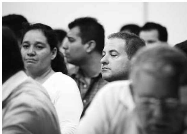
La fiscalía apoya su caso en las declaraciones de seis policías que actuaron como 'testigos'.