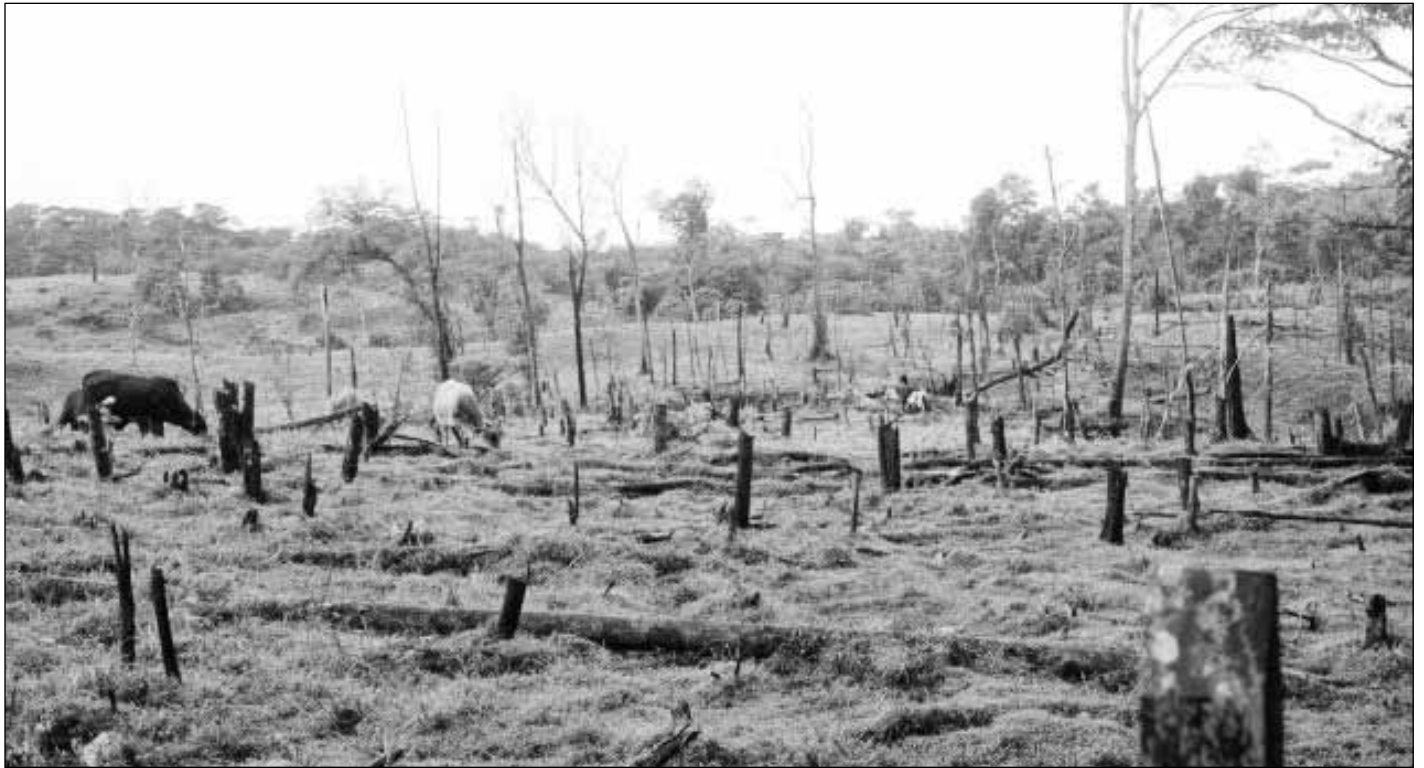
La frontera agrícola avanza cada vez más, en detrimento de los bosques de Bosawás.