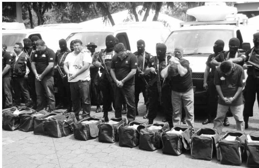
El grupo de falsos periodistas mexicanos desde el sábado enfrenta a la justicia en tierras nicaragüenses.

Granera aseguró que ahora trabajan junto a las autoridades mexicanas y centroamericanas para determinar la nacionalidad de los detenidos, aunque al menos a