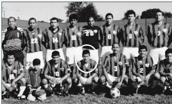
Fariñas formó parte del equipo de fútbol Walter Ferreti.

Uno era una discoteca (Ideas, S.A) y el otro era una venta de discos (Planet Music, S.A).