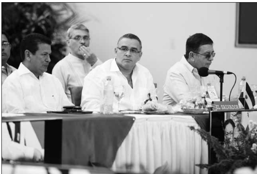
Mauricio Funes en la cumbre presidencial del SICA, se abogó porque el conflicto lo resuelva la CCJ con sede en Managua.

“Han logrado, por ejemplo, que los magistrados que fueron electos en el 2006 se van a mantener en sus cargos y que los magistrados electos en 2012 van a ser ratificados. Es decir son acuerdos evidentemente procedimentales y no sustantivos. Lo sustantivo sería que la