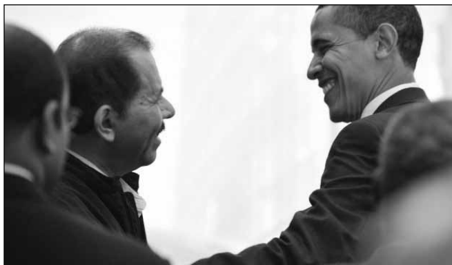
La decisión de Estados Unidos es una oportunidad para que Nicaragua vuelva a la institucionalidad, según empresarios y académicos.

La aprobación del waiver de la propiedad significa, para el economista, que el Gobierno podría fortalecer su programa de inversión pública si a los recursos del Banco Interamericano de Desarrollo y Banco Mundial le agrega la sobre-recaudación de impuestos que hubo este año, además de evitarse el otro impacto que hubiese significado