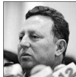
General de Ejército Julio César Avilés.