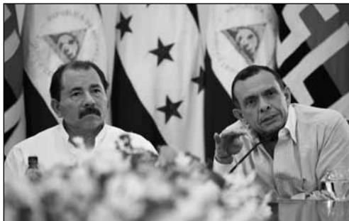
Presidentes Ortega y Lobo.

Semanas después de haber declarado su oposición contra la posibilidad de despenalizar las drogas, Daniel Ortega demandó el jueves en Managua un “compromiso efectivo” de parte de la comunidad internacional en la ayuda que entregan a Centroamérica en la lucha contra el narcotráfico y el crimen organizado.