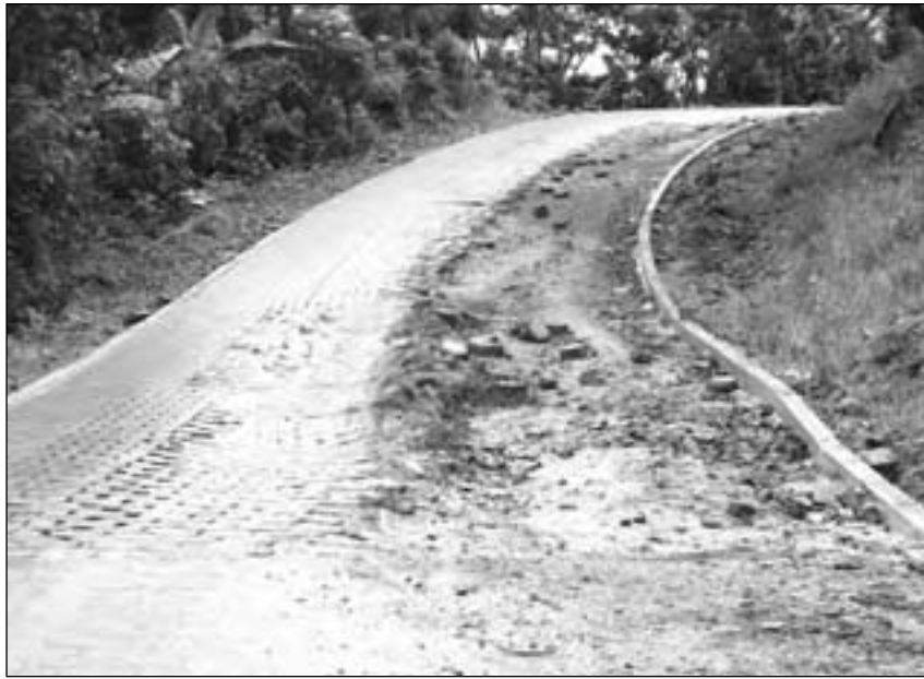
Así se mira uno de los tramos de la carretera, a apenas meses de haber sido construido.

(sistema de) drenaje”, explica el maestro de obras, moreno, bajito, con la piel del rostro seca por la constante exposición al sol. “La calidad de la construcción va a depender de la base”,