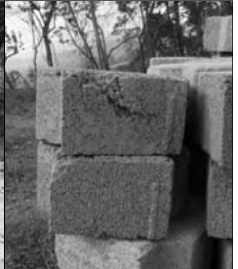
Los productores de Jinotega se quejan del mal estado de la carretera, mientras los expertos denuncian la mala calidad del material de construcción (derecha).