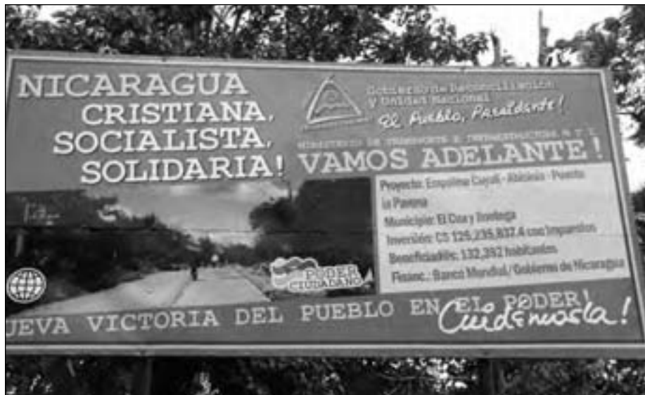
Letrero oficial que muestra el costo del millonario proyecto de adoquinado.

no pudieron supervisar que se cumpliera ese requisito. El ingeniero supervisor del MTI vino con un certificado de la Universidad Nacional de Ingeniería diciendo ‘aquí está lo que vos solicitas’. Y si vos miras el dato no puedes hacer nada, porque el adoquín cumple”, agrega el