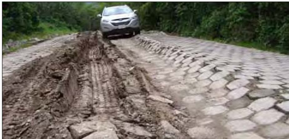
Vista de la carretera a Cuyalí que muestra el mal estado del proyecto financiado por el Banco Mundial.