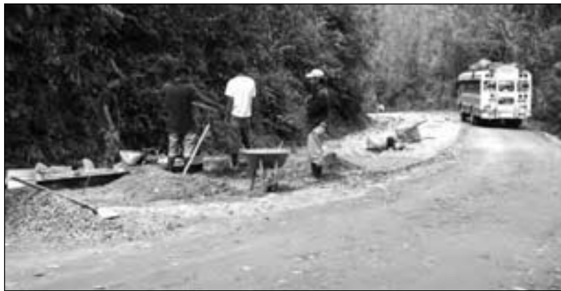
Entre las críticas hechas al proyecto está la contratación de personal no calificado.

Todas las fuentes consultadas para este reportaje culpan al alcalde de Jinotega, Leónidas Centeno, y las autoridades del MTI por el desastre en que se han convertido varios tramos del millo-