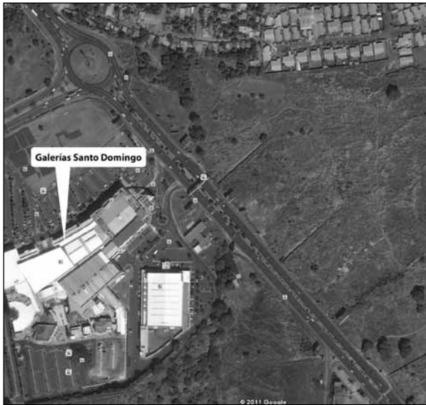
Imagen obtenida de Google Earth Pro que muestra el terreno en disputa, ubicado frente a Galerías Santo Domingo.