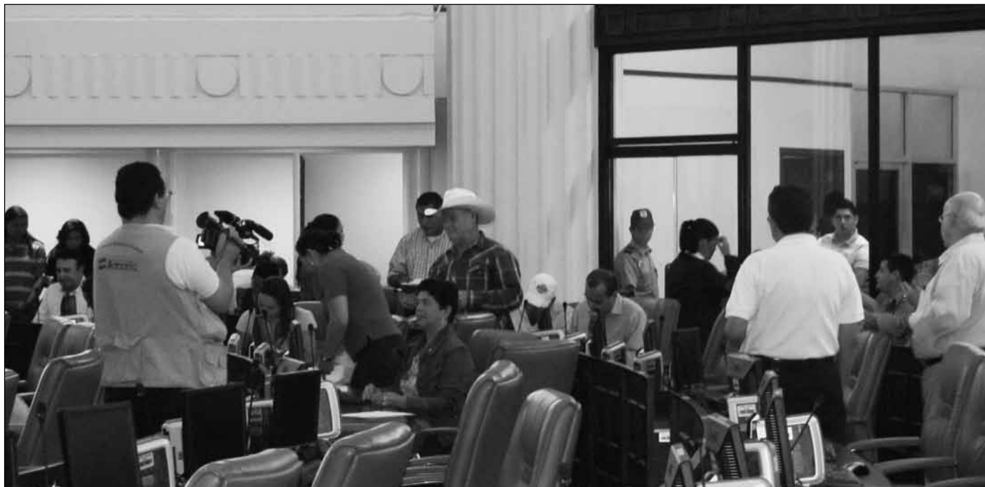
El jueves pasado los nuevos diputados electos por la Alianza PLI visitaron el Plenario parlamentario para conocer dónde se ubicarán en esta legislatura.