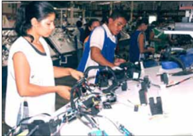
Empleados de la empresa Arnecom.

En el Foro, además de aprovechar para presentar la cara bonita del país, y de ofrecer espacios para hacer contactos de negocios (torneo de golf incluido), habrá ponencias