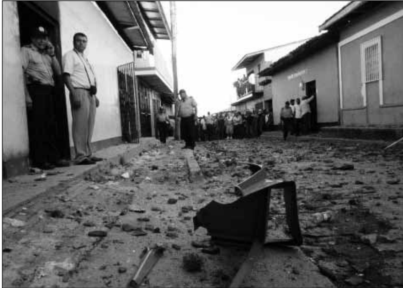
Imagen de los daños causados en San Fernando por las protestas de los ciudadanos que exigían su cédula.

“Ha prevalecido una negación sistemática del derecho al voto, nuestro deber será ahora dimensionar este fenómeno, es decir, a cuántos nicaragüenses se les niega este derecho político, así como dimensionar el sesgo político en los resultados presidenciales y en las de diputados. Son maniobras fraudulentas, aparte de los conteos irregulares y otros mecanismos”, dijo Courtney a medios locales.