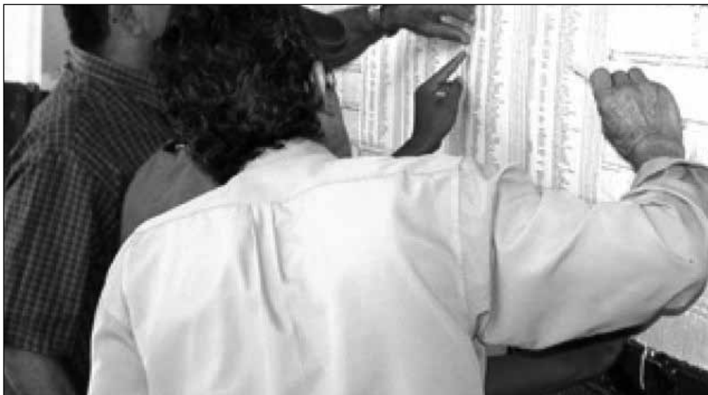
El CSE estima que el Padrón Electoral alcanzará los 4.2 millones de electores, cifra superior en 600.000 de las elecciones de 2006.