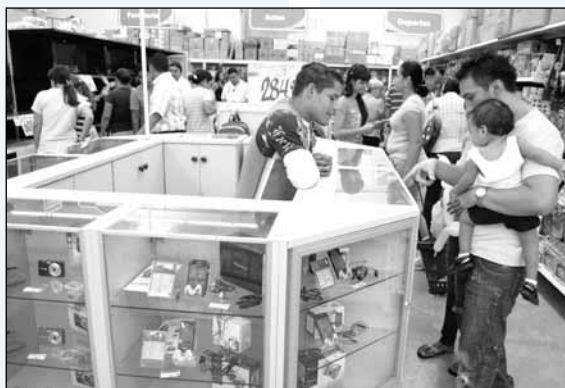
El nuevo formato incluye más que perecederos y artículos de uso personal.

A la par, la empresa está pidiendo autorización, si la cosecha de frijoles es buena, para exportar el grano, “porque eso le trae más divisas al país”.