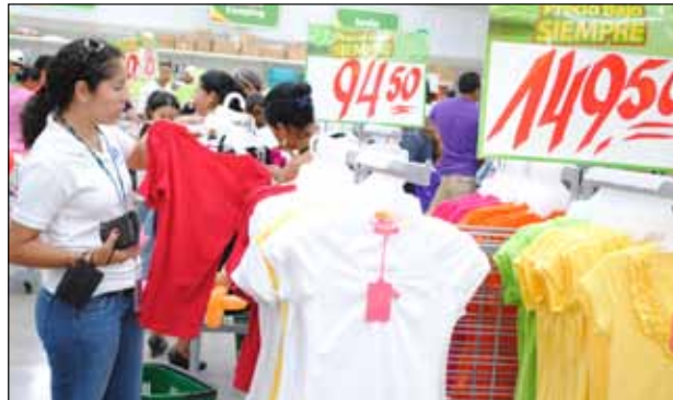
El público abarrotó la nueva Maxi Palí inaugurada en León el martes pasado.