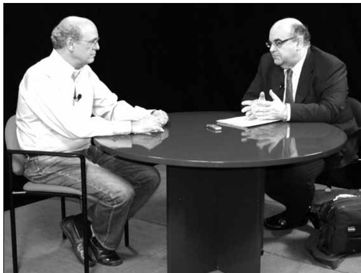
Esteban Beltrán, director de Amnistía Internacional en España

comprensión de sus familiares, la mayoría de estas niñas están en una situación difícilísima porque están, han sido violadas o abusadas por sus familiares más cercanos y la respuesta del Estado claramente es insuficiente, y creo que aún no han reconocido esa insuficiencia en la respuesta.