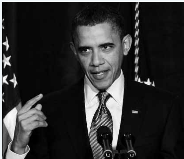
Barack Obama, presidente de Estados Unidos.