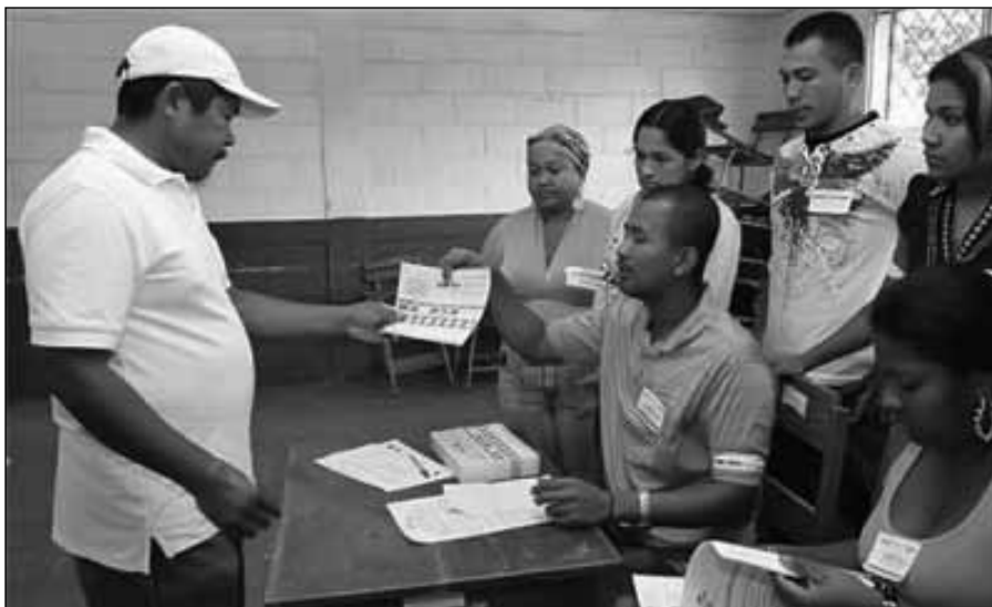
El CSE violó la Ley Electoral al no garantizar la pluralidad política en la designación de puestos dentro de los CEM.

La diputada informó que a inicios de mes interpusieron un escrito de reclamo ante el Consejo Supremo Electoral, en el que les exigían a los funcionarios de ese órgano el cumplimiento a la Ley Electoral y que le fuera otorgada a esta alianza el 33% de miembros que según Sequeira les pertenece por ley dentro de los CEM, pero hasta la fecha no ha habido una respuesta de los representantes del CSE.