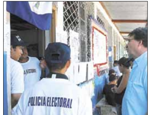
La oposición denunció el control del FSLN sobre los Consejos Electorales cuyos puestos fueron designados por los magistrados de facto del CSE.

Los magistrados de facto del Consejo Supremo Electoral (CSE) continúan con su estela de violación al reglamento electoral que deberían hacer cumplir. Los exmagistrados juramentaron a miembros de Consejos Electorales sin contar con la pluralidad establecida en el artículo 16 de la Ley Electoral, e incluso entregando cargos dentro de estos consejos a partidos que van en la alianza del Frente Sandinista de Liberación Nacional (FSLN), y que por