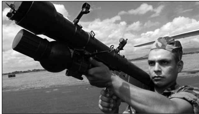
EE.UU propugna por la destrucción de 651 misiles antiaéreos.

En efecto, durante los actos oficiales del XXVIII Aniversario de la Fuerza Aérea, el 31 de julio de 2007, el presidente Ortega señaló en su discurso que estaba dispuesto a ordenar la destrucción de 700 cohetes tierra-aire (de un total de 1,100 en inventario), a cambio de equipos y suministros médicos para mejorar las instalaciones hospitalarias, dado que Estados Unidos no parecía dispuesto a otorgar helicóp-