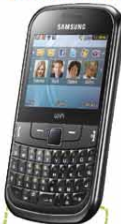
SAMSUNG GT S3350