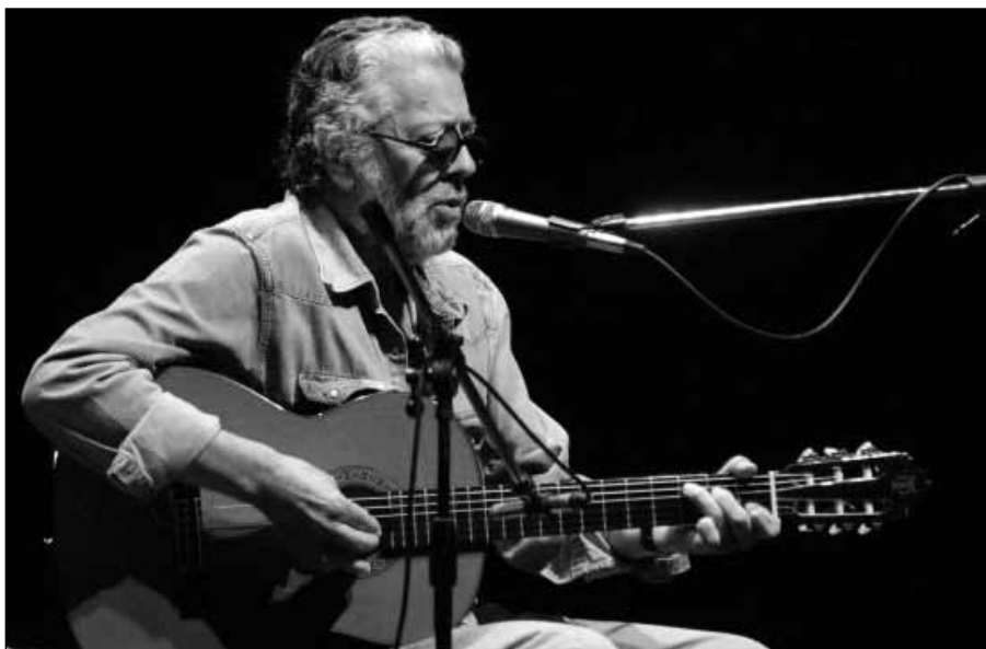
Facundo Cabral estuvo en Nicaragua la semana previa a su asesinato.

las cámaras de seguridad del hotel en el que estuvo hospedado Cabral, así como las de otros negocios de la ruta que siguió la comitiva criminal en persecución de la víctima, hasta el sitio en que se detuvo el vehículo que conducía Fariñas.