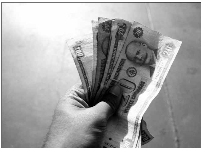
Los salarios nunca han caído tanto como durante la administración del presidente Daniel Ortega.

Aunque “el salario promedio de los maestros y otros trabajadores que prestan servicios directos a la ciudadanía continuó