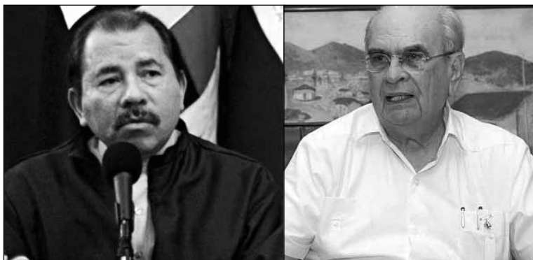
Daniel Ortega y Fabio Gadea, candidatos presidenciales.