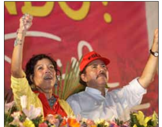
Rosario Murillo se proyecta como la gran promotora de la campaña de Daniel Ortega.