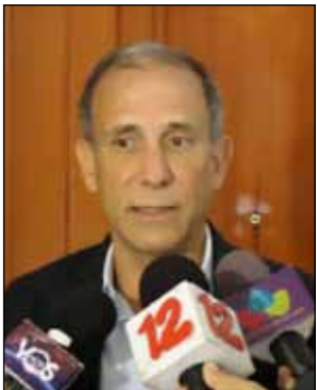
General Alvaro Baltodano

La competencia en el campo de las telecomunicaciones debería atraer otros US$170 millones, mientras se esperaba que el sector de zonas francas aportara US$70 millones más, con inversiones adicionales a través de ALBANISA en energía, infraestructura, agroindustria y forestería.