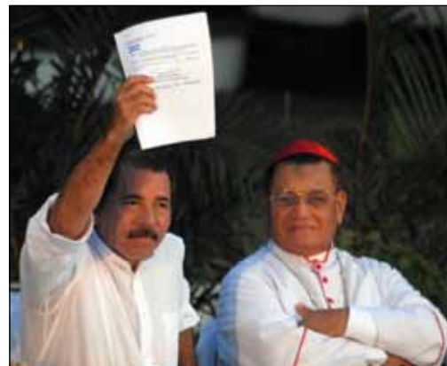
Después de muchos años de contradicciones, ahora Daniel Ortega y el cardenal Miguel Obando son aliados.

Una serie de cables diplomáticos emitidos desde el Vaticano y Managua al Departamento de Estado entre 2004 y 2008, revela los esfuerzos que realizó la Santa Sede para apartar a Obando de la política. En uno de los despachos se afirma que la iglesia romana intentó sacar a Obando de Nicaragua en las semanas previas a las elecciones presidenciales de 2006, pero que el cardenal no había acep-