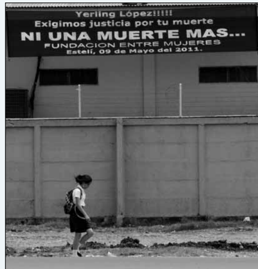
En Estelí, organizaciones de mujeres exigen justicia.

Eso sí, Pallais deja claro que con una ley, no se resolverá el problema de la violencia contra las mujeres. “Creo que las leyes no resuelven los problemas del país, menos en Nicaragua, donde hay una cultura de desprecio a la ley. No creo que el problema de violencia contra las mujeres se resuelva con esta ley”, asegura el diputado.