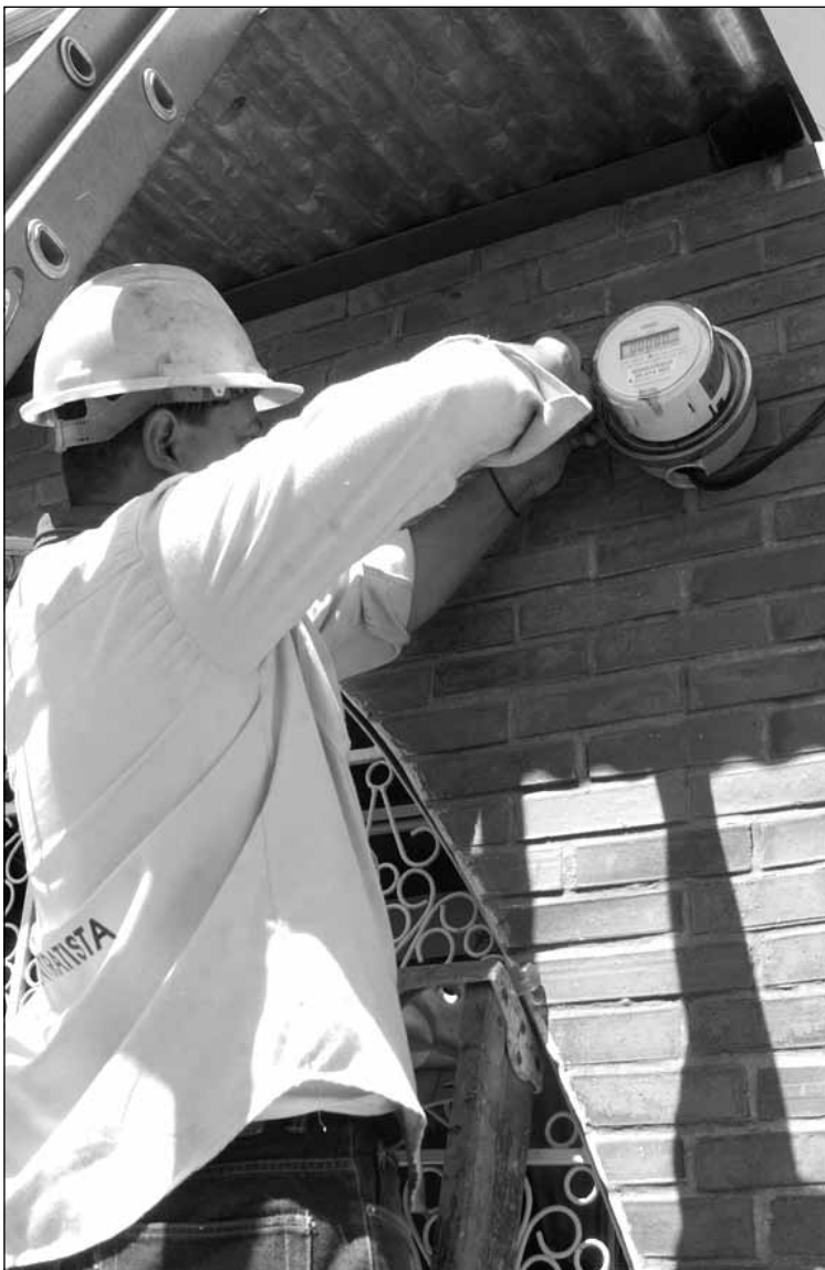
Diversos sectores cuestionan el alza de 41.8% en la energía