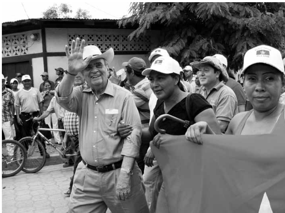
Fabio Gadea a su llegada a Wiwilí, en el departamento de Nueva Segovia.

Tímidamente la gente va acercándose alrededor de la tarima. Van cubriéndose del sol abrasador con sus anchos sombreros, gorras, sombrillas o simplemente con pañuelos. Sudan. Se aglomeran en las esquinas alrededor de la tarima, bajo la sombra de los techos, junto a los árboles. Muchos vienen por curiosidad. Quieren conocer al hombre que dio vida a un personaje que forma parte de su rutina diaria. Fabio Gadea Mantilla, el octogenario empresario radial creador de la serie “Pancho Madrigal” llegaría acá, al municipio de Wiwilí de Nueva Segovia,