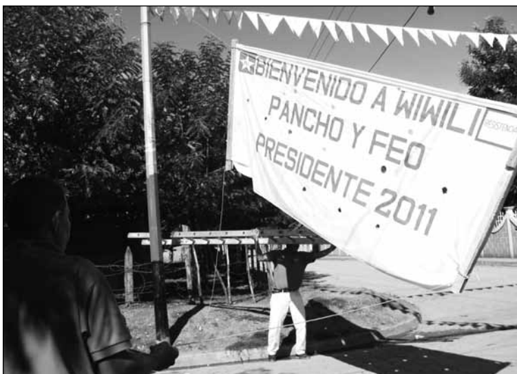
Trabajadores de la Alcaldía de Wiwilí montaron el escenario para el evento partidario de Gadea.