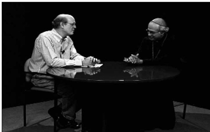
Monseñor Leopoldo Brenes declaró al periodista Carlos Fernando Chamorro, que buena parte de su tarea diaria es escuchar a la gente.

En ese sentido, dijo que desde Cáritas Internacional y su capítulo nacional, vieron que aunque el asistencialismo resuelve la necesidad inmediata, no es la mejor opción. “Hay que promover el empleo, para que la gente no tenga que andar extendiendo la mano, y para