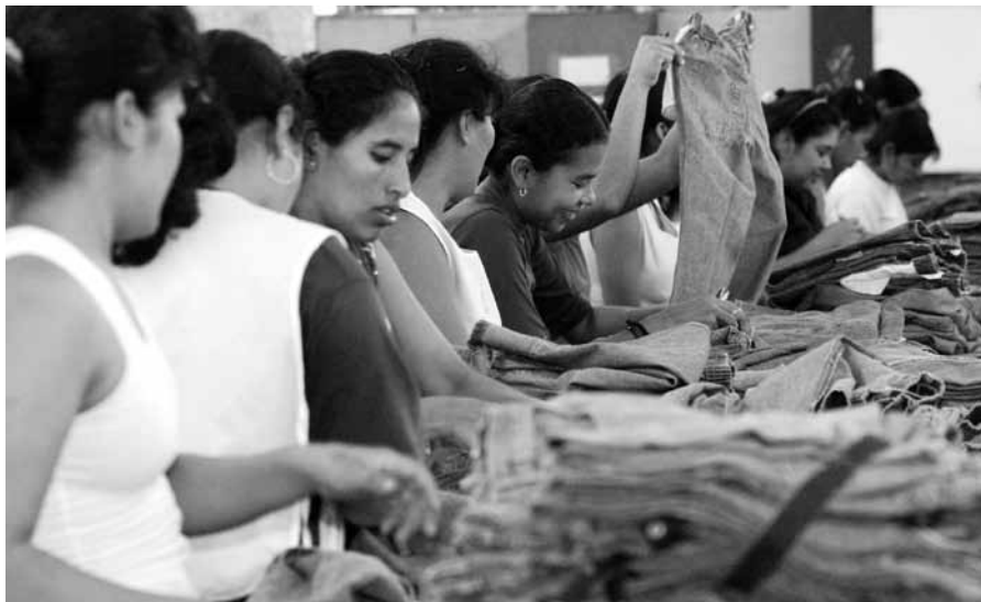
Los TPL concedidos por EE. UU. a Nicaragua permitieron crear miles de empleos.

Sandino insistió repetidamente que la experiencia mexicana había demostrado que el manejo público de los TPL había estado plagado de corrupción. Al respecto, los funcionarios