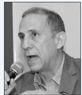
General Alvaro Baltodano

Más información y el texto de los cables originales de Wikileaks en: http://www.confidencial.com.ni/wikileaksnicaragua