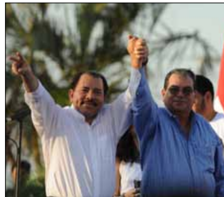
El presidente Ortega sorprendió al anunciar al ex jefe del Ejército como su vice.

El presidente Daniel Ortega sabe dar sorpresas. Esta vez lo hizo al anunciar el viernes a contrarreloj a su compañero de fórmula presidencial: el ex jefe del Ejército de Nicaragua, general en retiro Omar Hallesleven. Un golpe de efecto que para analistas consultados por Confidencial se traduce en un guiño para el Ejército, pero que no legitima una candidatura, la de Ortega, ilegal por estar prohibida por la Constitución.