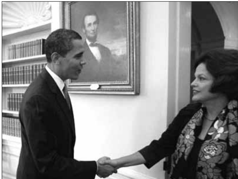
La presidenta de Brasil, Dilma Rousseff, se entrevista con el presidente Obama en Washington.

El caso de Colombia se destaca porque, al ser un estrecho aliado de EE.UU. durante tanto tiempo, no se incluyó en la agenda de Obama esta vez. Si bien es cierto, como la administración de Obama dice, tiene previsto visitar Colombia en 2012 (con ocasión de la Cumbre de las Américas en Cartagena), esta explicación no es convincente. Una reunión hemisférica no es lo mismo que una visita de Estado. Más plausible es que, dado que el destino del TLC con Colombia sigue siendo incierto, una visita de