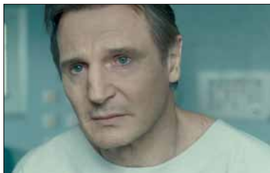
¿Cómo es que no soy yo mismo?: Neeson se sorprende como “Desconocido”

para matarlo. Son demasiados inconvenientes como para que le sucedan a un loco más.