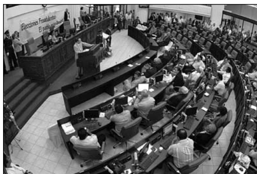
La oposición ha sido incapaz de frenar al presidente Daniel Ortega