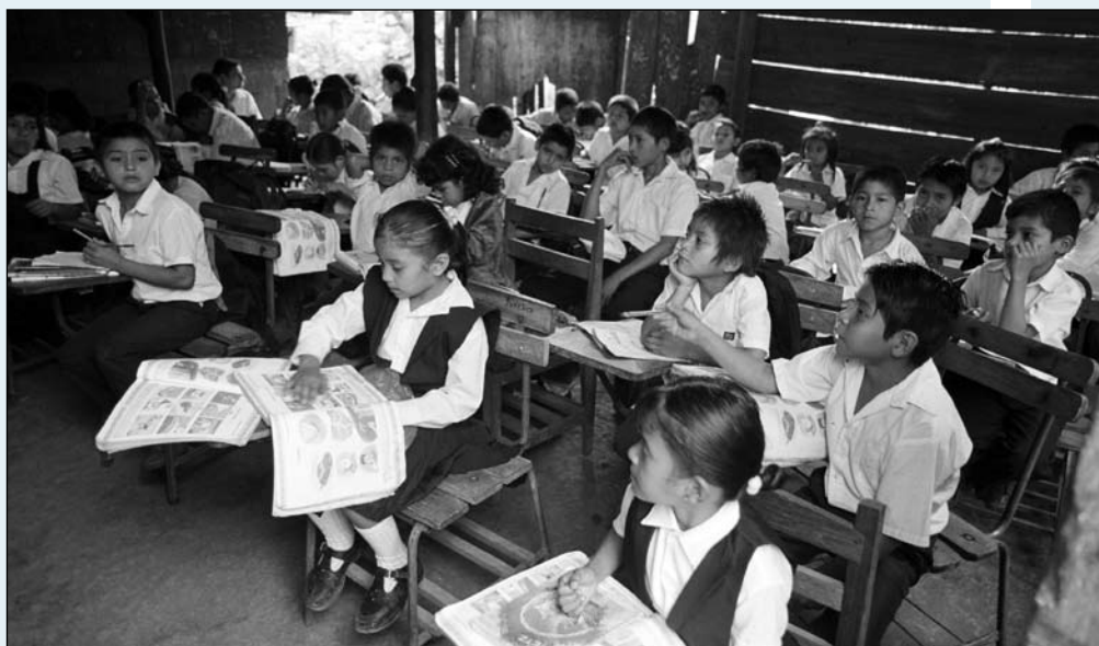
La iniciativa oficial apunta a incrementar cantidad, sacrificando calidad

“Para enfrentar este tipo de batallas”, explica Brenes, “ya no se necesitan guerrilleros ni turbas populares. Las nuevas batallas se ganan con talento y capacidades intelectuales desarrolladas al máximo. Sin ellas, se sufrirán los flagelos del fracaso y persistirá la condena de mantener a un pueblo engrosando y alargando las filas y niveles de pobreza extrema en un país clasificado entre los más miserables y subdesarrollados del mundo”.